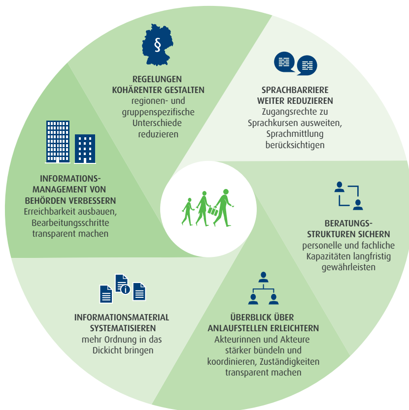
Abb. 2 Was können die beteiligten Akteurinnen und Akteure tun, damit Flüchtlinge das Asyl- und Aufnahmesystem besser durchschauen?