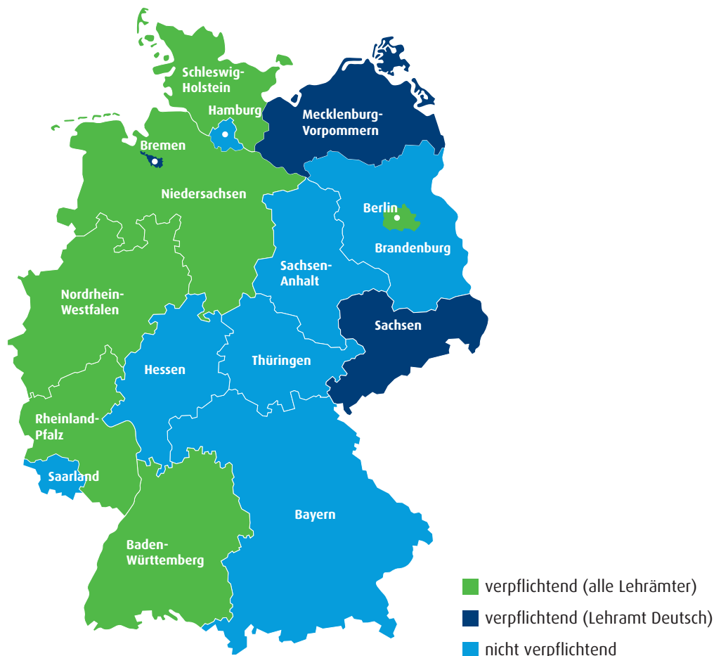
Abb. 1 Sprachbildung als verpflichtender Teil der Lehrerbildung in den Bundesländern

Anmerkung: Die Daten beziehen sich ausschließlich auf Landesregelungen zu Studien- und Prüfungsinhalten in der ersten Phase der Lehrerbildung (Stand: November 2015). Informelle Landesvorgaben sowie Hochschulpraktiken, die sich nicht in Gesetzestexten oder Verordnungen widerspiegeln, wurden nicht berücksichtigt. Die Daten beziehen sich zudem ausschließlich auf die Lehrerbildung für den Unterricht an allgemeinbildenden Schulen. In Bremen gilt die Verpflichtung nur für angehende Grundschullehrkräfte, in Mecklenburg-Vorpommern nur für zukünftiges Lehrpersonal an Grundschulen und Gymnasien.